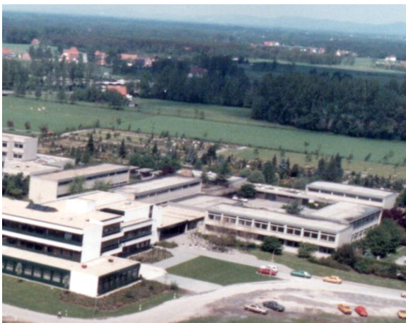
Der Ausschnitt aus einer Luftaufnahme aus dem Jahr 1981 zeigt den gesamten Gebäudekomplex der Realschule Verl; im Vordergrund ist ein Teil des Gymnasiums mit seinen grünen Fensterrahmen zu erkennen.